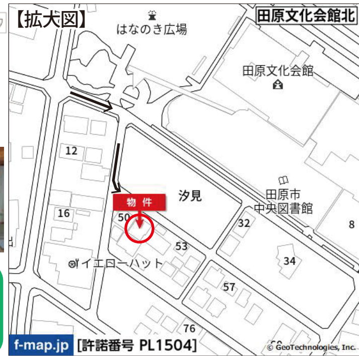
f-map.jp [許諾番号 PL1504]