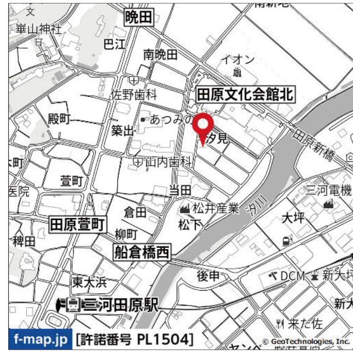
f-map.jp [許諾番号 PL1504]